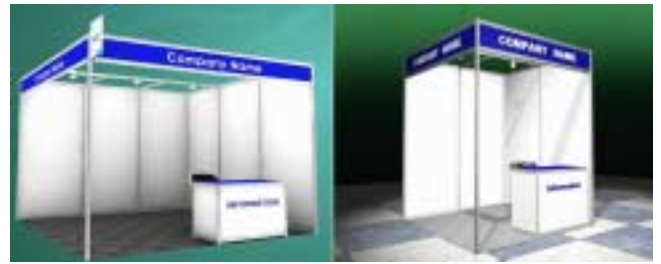
Fig. 4. Types of booth. Standard booth(left) and mini booth(right).

1,000여명이 넘는 해외 참가자들을 고려하여, 전시장 내 한국 문화를 소개하고 체험할 수 있는 다양한 이벤트 부스 구성