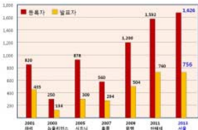
Fig. 1. Number of participants and presentations(oral and poster) in each IAPD congress.

초청 연자와 좌장을 지역별로 배분하여 각 대륙별, 나라별 관심을 유도하였다(Fig. 2). 한국을 처음 방문하는 외국인들에게 낯선 한국에 대한 거리감을 없애기 위해 한국의 관광 자원들을 이용한 다양한 이미지로 사전에 35차례의 전자메일(e-blast)을 꾸준히 발송하였다. 페이스북을 통해서도 한국의 일상적인 모습들을 담아 참가자들에게 자연스럽게 친근감을 높였다. 무엇보다도 역대 IAPD 대회에서는 시도하지 않았던 ‘개발도상국가 참가자 등록비 할인 정책’을 통해 대회 참가의 장벽을 많이 낮추었다. 특히 카자흐스탄, 캄보디아와 같은 개발도상국가의 참가자들이 100명 이상 서울 대회에 참여하면서 IAPD 세계 무대에서 진정한 의미의 참여와 협력의 장을 마련하였다.