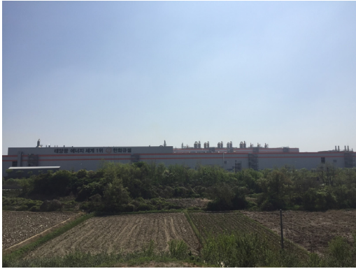
그림 4. 한화솔루션 진천공장 전경