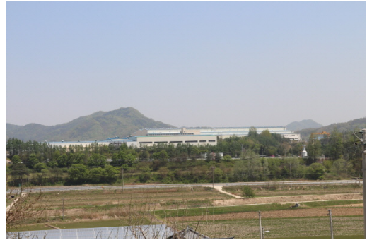
그림 2 현대에너지솔루션의 전경

음성 입지의 결정적인 사건은 2007년 1월 음성군과 맺은 투자협약이었고, 이에 따라 현대중공업은 18억 원 규모의 지원을 받을 수 있게 되었다. 신설 공장의 부지는 소이면에 위치한 한라중공업 소유 2만평의 땅을 매입하여 마련되었으며, 이곳에서는 2007년 8월부터 울산공장의 모듈 생산라인을 이전해 가동되기 시작했다(그림 2). 19) 2008년 5월에는 음성 태양전지 제1공장이 준공되어 생