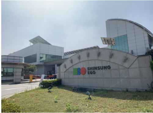
그림 3. 신성이엔지 증평공장 전경

다. 또한 태양전지 양산라인에는 우리 회사의 기존 제품인 클린룸이 똑같이 필요한데, 장비와 태양전지 관련 우수인력을 보유하고 있어 충분히 사업성이 있다고 봤다.” 34)