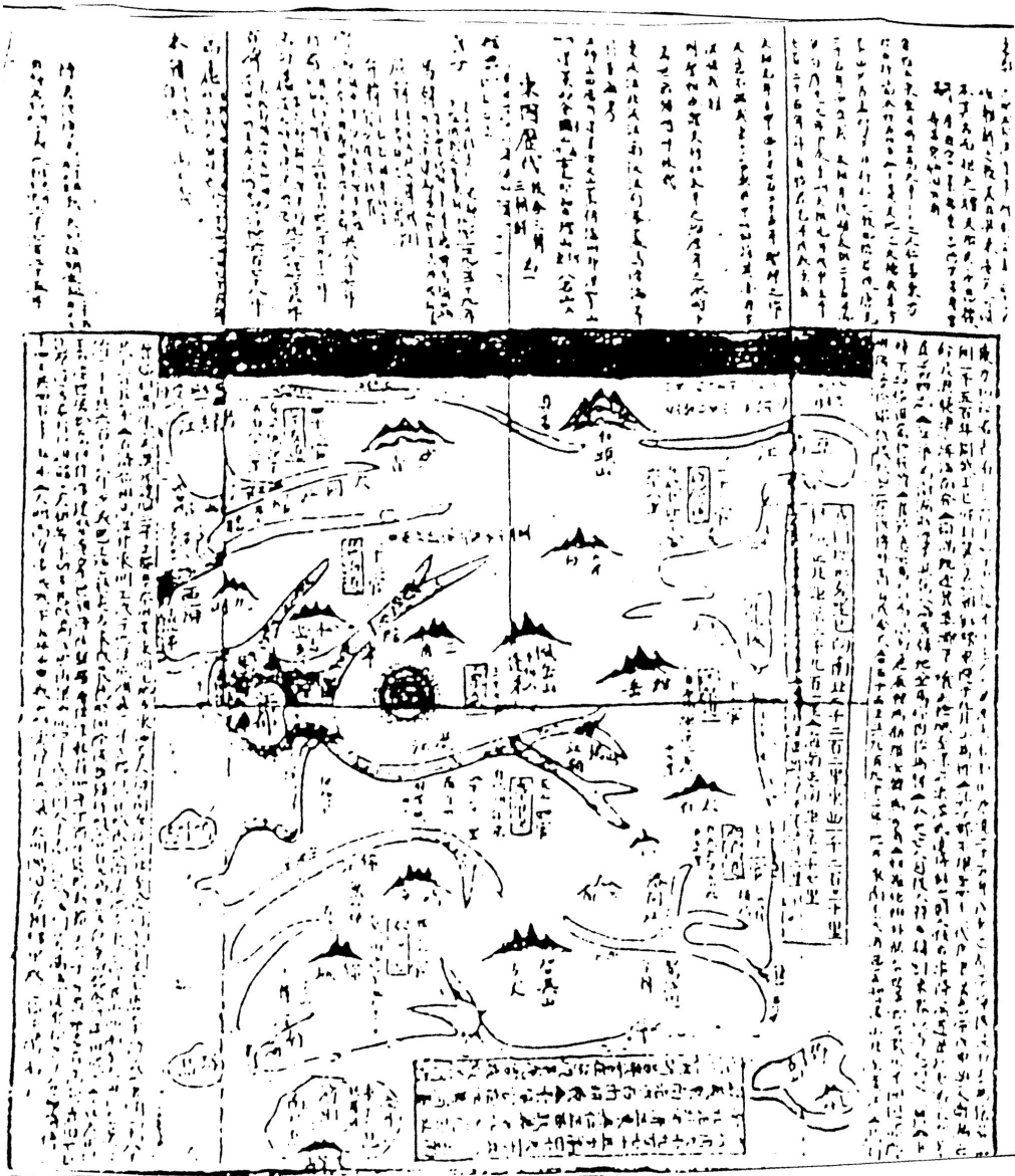
「國立中央圖書館」所藏「東國八道大總圖」