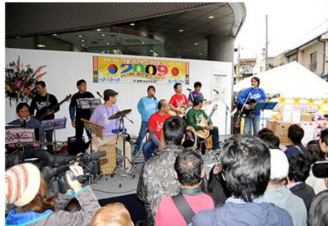
사진3 이쿠노코리아타운 공생마쓰리 풍물놀이 · PTA라이브 공연 (2009년 오사카미나미 블로그 촬영7)