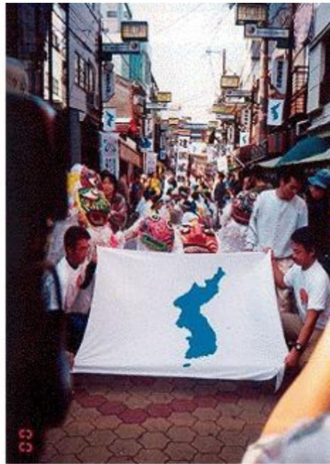
사진2 원코리아페스티벌 전통무용 · 풍물퍼레이드(2000·2001 필자촬영)