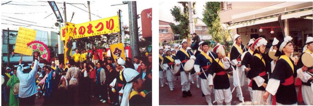
사진4 일본 마쓰리의 풍물놀이 (1999년, 2002년)

가와사키시의 재일코리안 형성과정에서 본바와 같이 사쿠라모토는 재일코리안이 많은 지역으로 일본 마쓰리는 지역 사람들이 함께 서로 교류하고 즐기면서, 앞으로의 사쿠라모토상점가진흥조합의 발전을 위해 안과 밖으로 어필할 목적 하에 개최되고 있다.