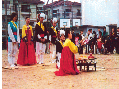
사진1 이쿠노 민족문화제 농악놀이 · 교사