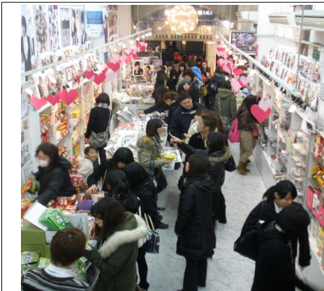
사진 1. 도쿄 쇼쿠안도오리 코리아타운 한류상품 판매 모습

드컵과 최근 한류문화의 유행을 거치면서 코리아타운은 한국의 전통음식 체험, 김치 만들기, 한국요리교실, 한국어강습회 등 일본인들을 위한 다양한 행사들을 주최하고 있다. 또한 이 지역은 한국으로부터 직수입한 식품이나 현장에서 직접 요리한 한국음식, 다양한 김치종류, 한복(수제작), 제사상에 올라가는 육류(삶은 돼지고기), 불고기(야끼니쿠), 최근 한류상품까지 취급하는 가게들이 즐비하게 늘어서 있다. 초국적인 글로벌시대 오사카지역 코리아타운에 거주하는 올드커머들은 이와 같이 현지에서 재일코리안문화와 한류문화를 결합하여 그들만의 새로운 문화를 탄생시킨 주역으로서 일본인과의 공생프로그램증가, 한글학교운영, 한류 문화상품 판매 등 일본에서 한류문화의 원조로서 중요한 역할을 해왔던 셈이다.