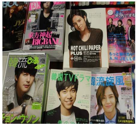
사진 2. 일본 대형서점(紀伊国屋) 잡지 코너 한류스타 소개(필자 촬영)

반대로 도쿄 신오쿠보(新大久保) 코리아타운은 뉴커머가 중심이 되어 발달한 지역이다. 글로벌시대(Globalization) 도쿄 신오쿠보코리아타운은 한류문화의 확대와 뉴커머들의 상업 활동에 미친 영향은 실로 대단하다. 5) 신오쿠보도오리에서 1980년대 후반에 한국어학원을 설립하여 지금은 도쿄 중심 4개 지역에 진출한 A 회장에 의하면 “코리아타운은 몇 년 전까지만 해도 소규모자영업 수준의 식료품점과 식당들이 대부분을 차지했다. 당시 일본의 경제적 불황과 한국인들 간의 가격경쟁으로 상당히 침체되어 있었다. 그러나 한류가 이러한 흐름을 단번에 바꾸어 놓았다. 한인상대의 식료품점이나 PC방들이 일본인을