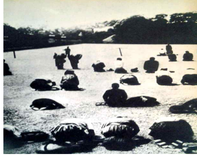
사진 2) 『アルバム戦後15年史』, p. 5.

는 사람들의 표상이다 15) . 즉 사진집 안에서 패전은 이 두 가지 표상으로 구성되고 있다고 볼 수 있다. 특히 천황이 있는 황거를 향해 엎드린 사람들의 사진은 두 권의 사진집에서 같은 사진이 게재되고 있다 16) .(사진 2)