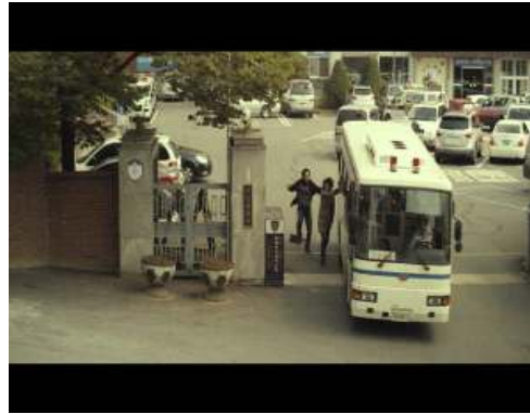
<그림6> 한국판에서는 화선이가 울면서 송치되는 차량을 따라간다.

위의 그림과 같이 각 영화들의 마지막 장면에서 생각해 볼만 하다. 일본판의 제목에서 ‘헌신’의 단어와 여자가 마지막에 달려와 울면서 자수한 장면이 상응을 한다면, 한국판의 제목에서는 ‘헌신’이라는 단어가 없으며 여자가 마지막에 달려와 울지만 자수하지 않는다는 점에 상응을 하고 있다.