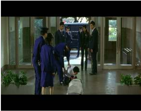
<그림5> 일본판에서는 야스코가 자수하면서 운다

여자에 대한 배신감이었다. 여자가 다른 남자에게 관심을 갖고 있다는 질투와 질투를 넘어선 배신감이 차올랐다. 그리고 주인공은 자신이 이 여자를 위해 어떠한 일을 저질렀는가에 대한 자문을 한다. 주인공은 자수를하기로 결심한다. 이는 여자에 대한 응징이라고도 할 수 있다. 양국의 영화적 재현에서 남자의 헌신을 어디까지로 봐야 하는가에 대한 사유를 만들게 한다.