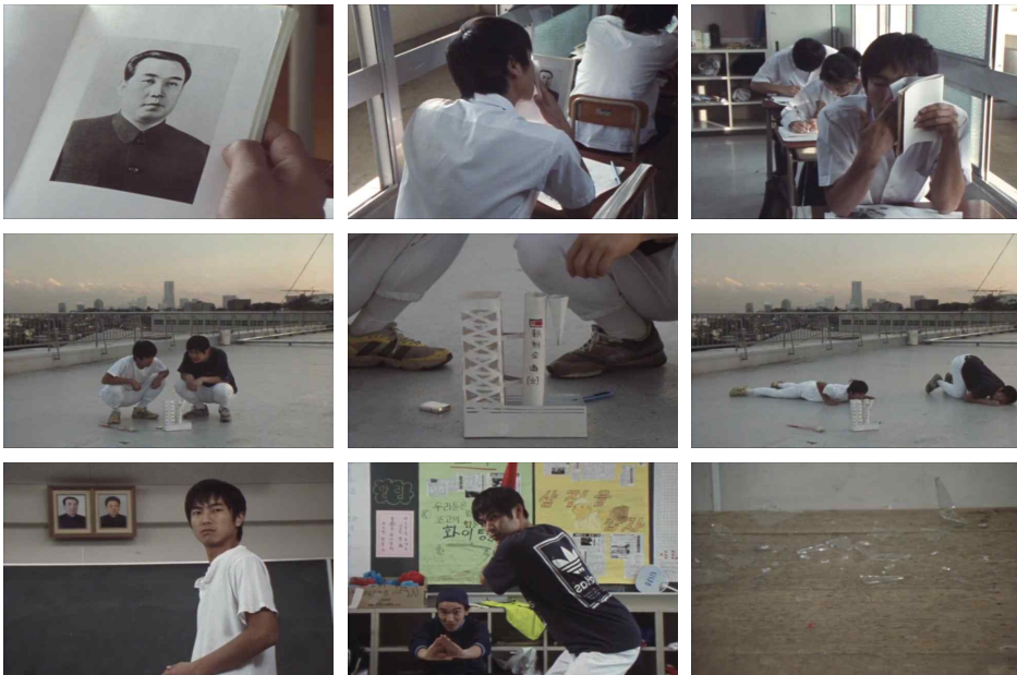
図1. 祖国に無関心な生徒たち

(00:03:43～00:03:52／00:05:17～00:0600／00:21:00～00:21:28)