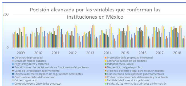
Gráfica 2. Posición alcanzada por las variables que son consideradas por el WEF para la evaluación de las instituciones en México durante 2009 al 2018.