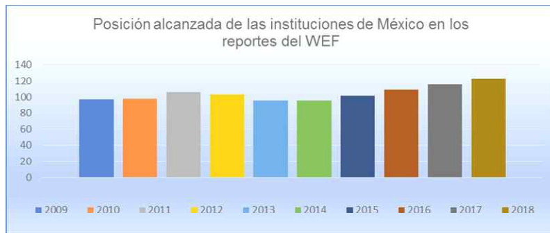
Gráfica 1. Posición alcanzada por las instituciones en México de acuerdo con la evaluación del WEF del año 2009 al 2018.