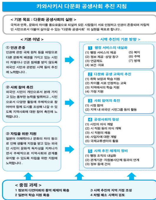
〈그림 3〉 가와사키시 다문화 공생 사회 추진 지침

민’이라는 용어를 사용하고 있다. 그런데 가와사키시의 경우 외국 국적의 주민을 지역사회를 구성하는 귀중한 일원이라고 여겨, 1996년 가와사키시 외국인 대표자 회의 조례의 제정을 계기로 ‘외국인 시민’이라는 어휘를 사용하고 있다(라경수, 2012). 또한 외국 국적의 주민뿐 아니라 일본 국적이어도 외국에 연고가 있는 분(국제결혼에 의해 태어난 자녀, 중국 귀국자, 일본 국적을 취득한 사람)에게도 ‘외국인 시민’이라는 어휘를 사용한다(川崎市, 2015).