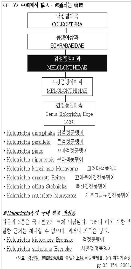
Table 4. The Literatual Classification on Chinese QíCáo Imported from China and Distributed into Korea