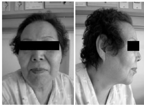
Fig. 1. The Front & Lateral Side of the Face

본 증례는 惡心 嘔吐를 주소로 입원한 太陰人 소뇌경색 환자가 사상의학적 관리를 통해 호전된 예로 이에 보고하는 바이다.