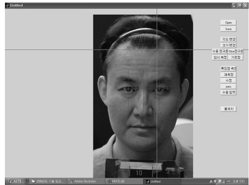
Fig. 1. 안면특징측정프로그램