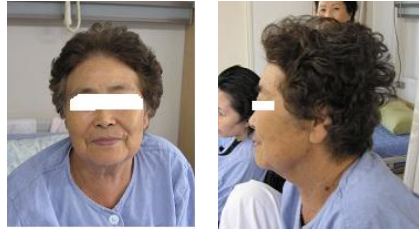
Fig. 1. Patient's Anterior and Lateral View