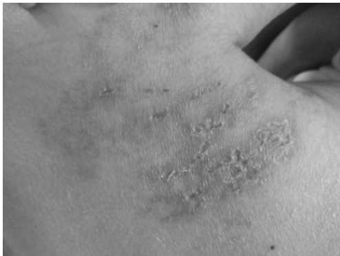
Fig. 6. The change of vesicles. (3.3)