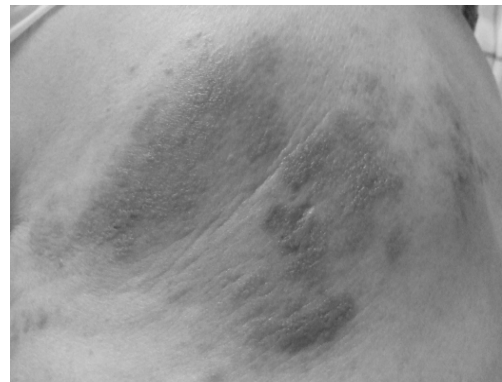
Fig. 2. The change of vesicles. (1.26)