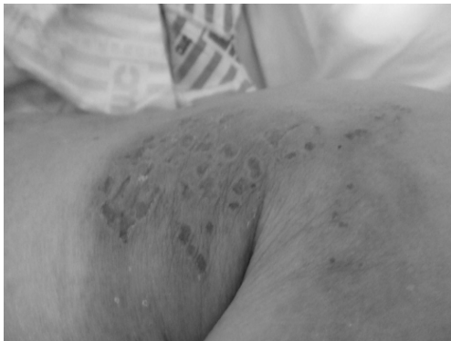
Fig. 5. Picture of vesicles. (2.26)

상기 환자는 입원당시 右側 胸背部, 腋下部位에 발생한 帶狀疱疹 부위가 비교적 넓은 편이었고 평소 더위를 많이 타며 머리 쪽에 땀이 많이 났다. SAH 발병 이후 小便不利 나타나 도뇨관을 삽입하였고 대변은 硬便을 1회/1~2日 보았다. 밤에는 잠을 깊게 못 자고 자주 깨서 병실 밖으로 나가려 하고 帶狀疱疹 부위를 긁었다. Fig. 5는 치료 시작일인 2월 26일로 환자의 Cognitive impairment로 인하여 疼痛 및 癢痒感을 참지 못하고 환부를 긁어서 水疱가 모두 터지고 상처가 남은 상태였다. 患部 감염이 우려되어 Simple dressing을 시행하였고 3월 2일경부터 癢痒感을 덜 호소하고 밤에 깨는 횟수가 줄어들고 잘 자기 시작했다. 치료 일주일째인 3월 3일 Fig. 6에서 患部の 면적이 줄어들고 痂皮로 변화하였음을 볼 수 있다. 3월 10일 Fig. 7에서 水疱 및 痂皮의 흔적이 거의 사라진 채로 치료 종료하였다. 환자가 호소하는 熱感 및 頭部汗出은 줄어들었고 밤에 깨서 밖으로 나가려 하지 않고 잘 자게 되었다. 대변은 정상변을 보기 시작했고 3월 8일에 도뇨관을