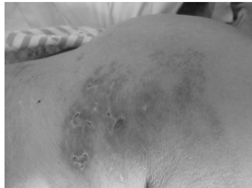
Fig. 7. The change of vesicles. (3.10)