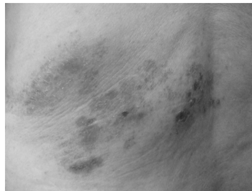
Fig. 4. The change of vesicles. (1.30)