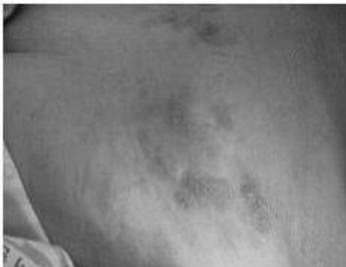
Fig. 1. Picture of vesicles. (1.24)