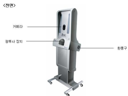
Fig. 1. 3D-AFRA(front)

3차원 안면자동인식기는 사상체질 분석을 위해 사람의 안면 데이터를 추출하고 이를 인식하는 시스템이다. 즉 본 시스템은 안면의 3차원 영상을 재현할 수 있는 시스템으로서 얼굴의 해부학적이고 형태학적인 특징 점을 추출함으로써 사상체질별 안면 형태 연구 및 체질진단의 객관화에 도움을 줄 것이다. 기본구조는 Fig. 1과 같이 스틸 소재에 카메라, 광원 등이 장착되어있다. 부수적인 장치로 이미지를 저장 및 촬영한 영상을 처리할 수 있는 PC가 있다