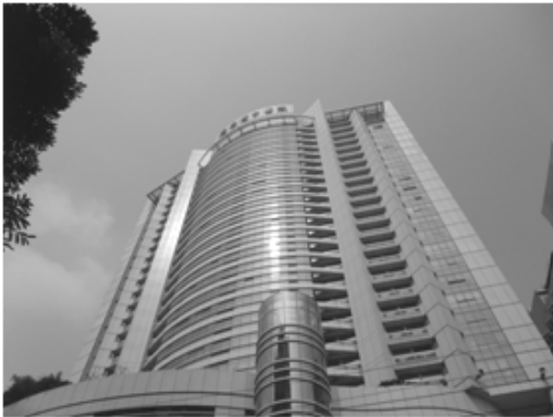
Fig. 5. External appearance of "Guandong provincial hospital of Chinese medicine"