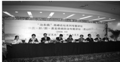
Fig. 2. Forum for health administration center 2