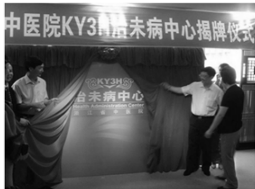
Fig. 4. Health administration center at 'Zhejiang provincial hospital of Chinese medicine"