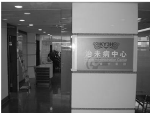
Fig. 3. Health administration center at "Guandong provincial hospital of Chinese medicine"