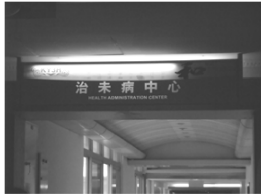
Fig. 6. Entrance of health administration center