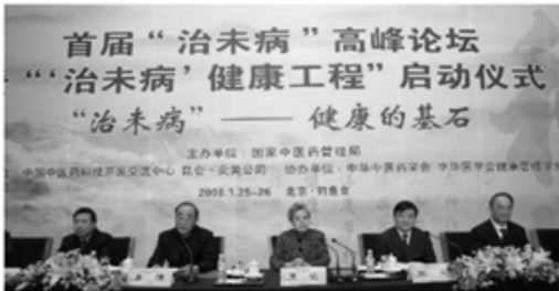
Fig. 1. Forum for health administration center 1

치미병센터는 새로운 건강보장모델을 실행하여 개인의 건강상태에 따라 예방, 보건, 진단, 치료를 하는 업무를 담당하는 기관으로 중국중의과학원, 昆崙-