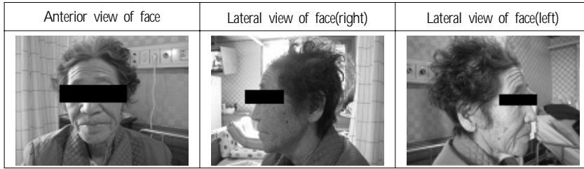
Figure 1. Face of the patient