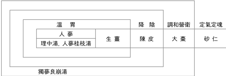
Figure 2. The constructive principles of Insamjinpi-tang (人蔘陳皮湯)

시켰다. 附子が 들어간 처방인 獨蔘附子理中湯과 人蔘附子理中湯이 있고, 附子が 없는 人蔘陳皮湯과 人蔘桂皮湯이 있다. 즉, 附子를 중심으로 처방의 계열이 달라지는 것이다.