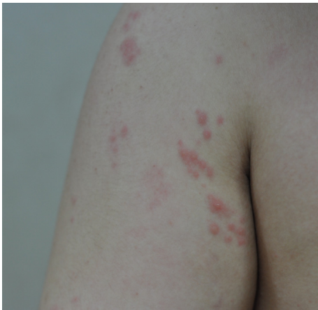
Figure 1. Picture of vesicles(9/5)

severe: +++, moderate: ++, mild: +, trace: ±, elimination: -