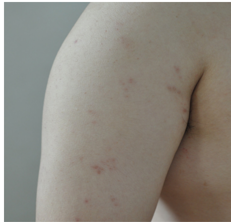
Figure 2. The change of vesicles(9/15)