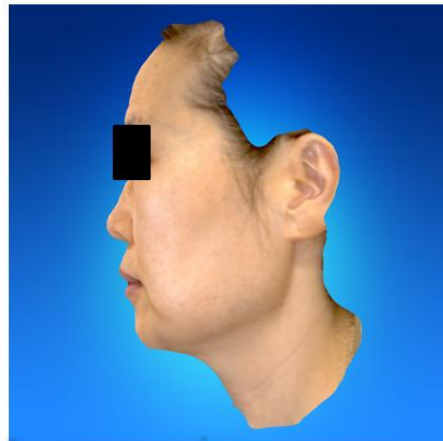
Figure 1. Anterior and lateral view of face scanned by 3D facial scanner