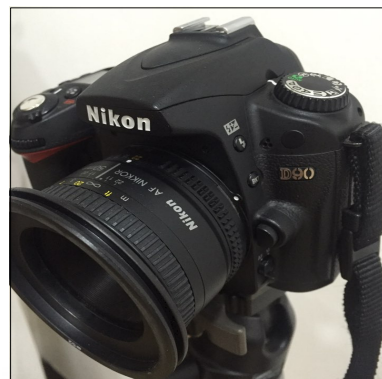
Figure 1. Nikon D90, Japan

피험자 얼굴 영상을 획득하기 위해 디지털카메라(Figure 1)로 얼굴 전면과 측면을 촬영하고 영상을 획득하였다.