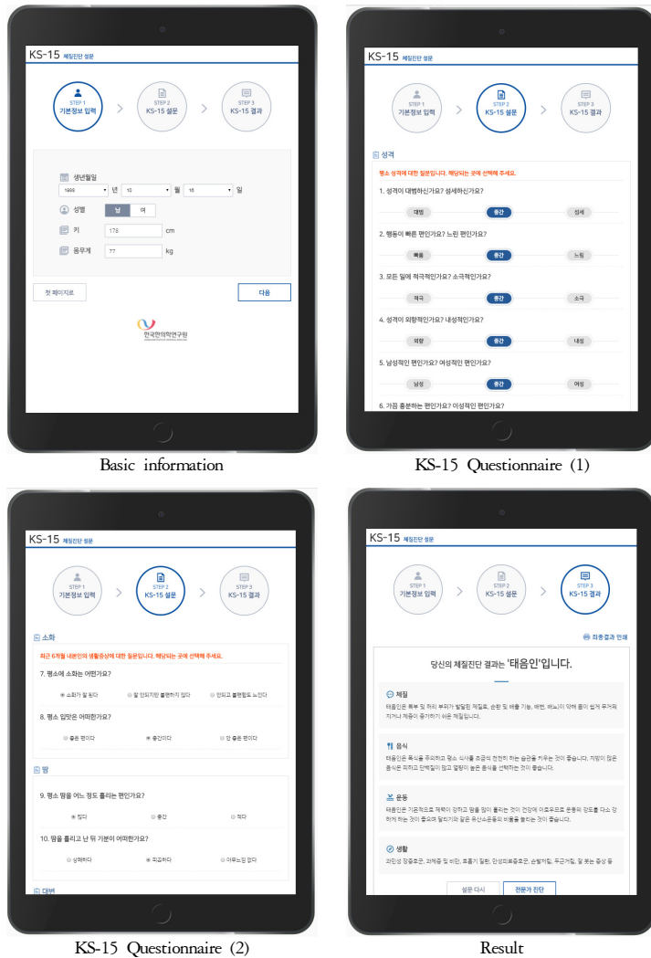
Figure 2. Steps on simple mode