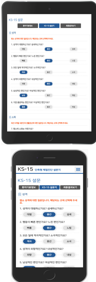
Figure 1. Screenshot for KS-15 Questionnaire on Tablet PC and Smart Phone

KS-15 웹 시스템의 사용자 인터페이스는 사용자의 단말에 상관없이 설문지 응답을 쉽게 할 수 있도록 하였다. 단말에 따른 설문지 화면은 다음과 같다(Figure 1).