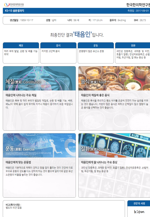
Figure 4. Screenshot for print page