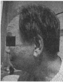
그림 3 The lateral side of the face