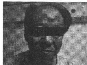
그림 1 The front side of he face

상기 환자는 키 183cm에 체중 91kg의 체중으로 나이에 비해 건장하고 큰 체격이었으며, 전체적인 체형기상은 상체와 하체가 비교적 고르게 발달되었다. 얼굴과 상부 체간부위에 열색이 선명하였으며 땀을 자주 흘리는 편이었고, 주리가 다소 거칠면서 살집이 좋은 편이었다. 평소에 말이 많았으며 성격이 급하고 고집이 센 편이었다. 임상적으로 사상체질과 전문의가 태음인으로 판단하였으며 더불어 의사결정나무법 3) 상 태음인의 가능성이 큰 것으로 판정되었다.(Figure 1~3는 치료 기간중 자립 및 자력 보행이 가능한 상태에서 촬영하였다.)