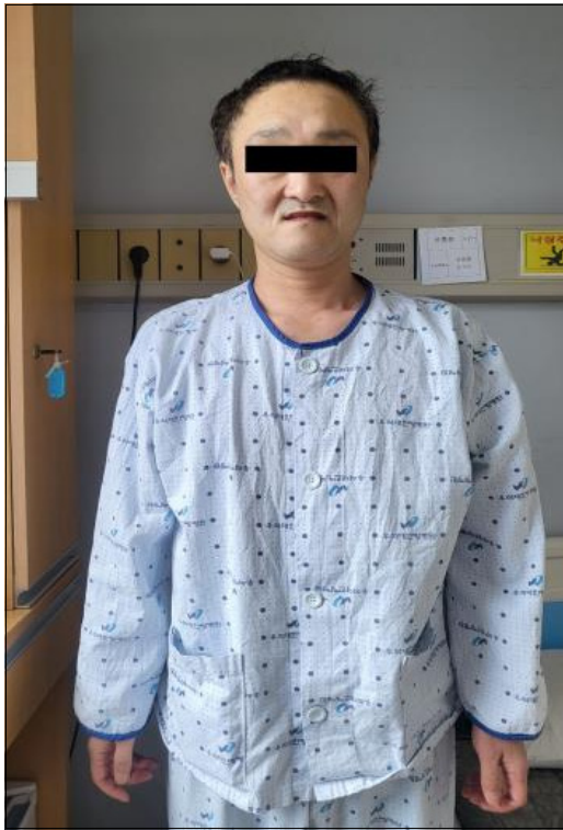
Figure 1. Appearance of patient's face