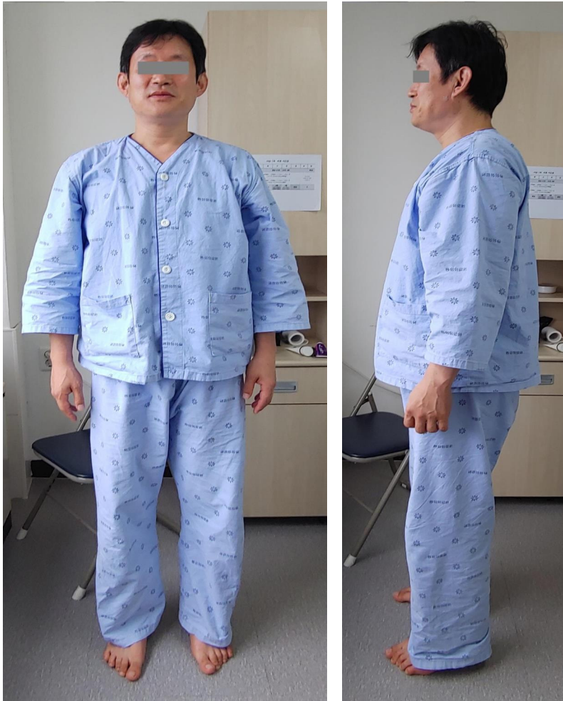
Figure 1. Anterior view and lateral view of full-length (2020.8.19)