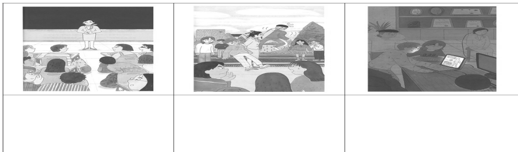
〈표 4〉 그림 보고 책 내용 예상하기(자료)

(가) 그림을 보고 등장인물들이 무엇을 하고 있는지, 이 책은 어떤 내용인지 예측하여 이야기한 후 적는다.