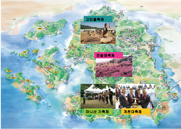
〈그림 2〉 강화 대표 4대 문화축제(진달래축제·고인돌축제·마니산 기(氣)축제·개천 대축제) 현황 및 장소