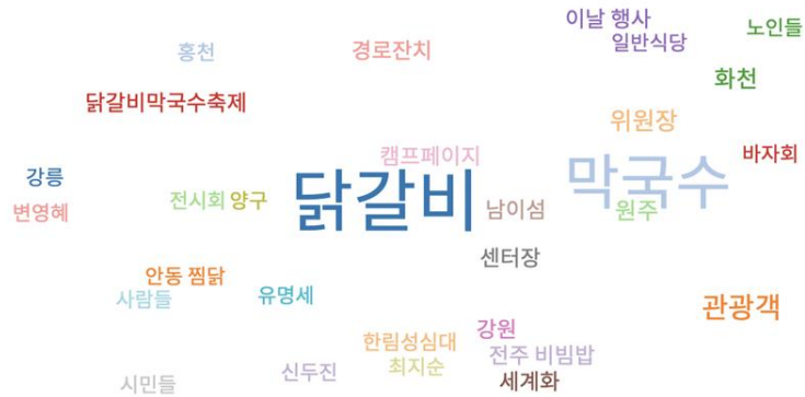
그림1. 텍스트 마이닝(Text mining)으로 본 강원도의 대표 음식

지역별 사전조사, 사전조사에 의거한 기초조사는 언론사의 보도 기사를 중심으로 ‘워드 클라우드 검색 기법’, ‘텍스트 마이닝 기법’을 동원하여, 강원도 전역의 지역별 노포를 확인했고, 이곳을 직접 방문하여 인터뷰하거나 유무선 전화 및 메시지 등의 간접적인 방식을 통해서, 해당 노포의 유래와 연원, 이곳에서 만들어내는 대표 음식에 대해서 살펴보았다.