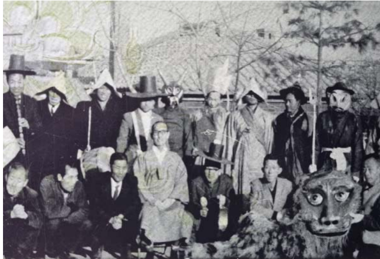
〈사진 4〉 1957년 속초에서 북청사자놀음을 하고 난 후 연희자들 기념사진