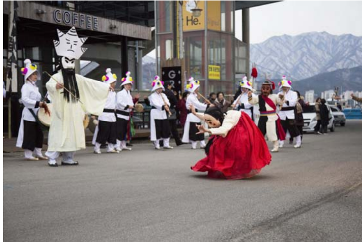
〈사진 7〉 속초사자놀이 공연 2