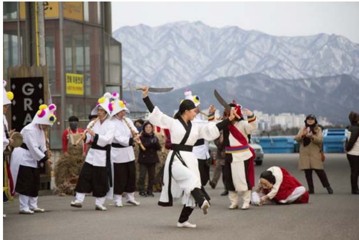
〈사진 8〉 속초사자놀이 공연 3