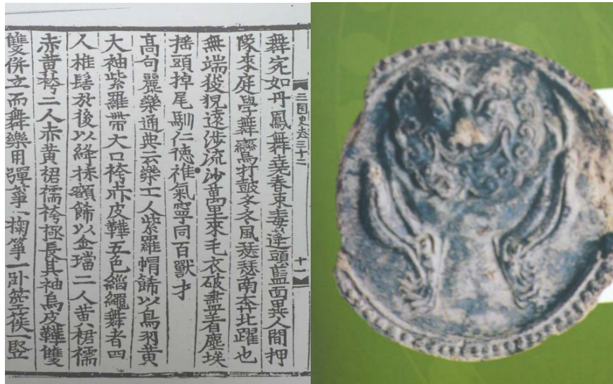
〈사진 2〉 최치원의 글과 태백 본적사지 출토 유물

신라 말기 때 최치원(857~?)이 쓴 향악잡영(향악雜詠) 5수 가운데에도 산예(狻猊)라는 사자놀이 내용을 보면 “사막을 지나서 몇 만 리를 왔느냐(遠涉流沙萬里來), 털은 다 빠지고 먼지투성일세(毛衣破盡着塵埃). 머리를 흔들고 꼬리를 치며(搖頭掉尾順仁德) 사람 말은 잘 듣지만 역센 그 기운 짐승중의 왕이로다.(雄氣寧同百獸才)”라고 읊었다. 15 이 시에 나오는 유사는 사막의 명칭으로 서역일대 고비사막을 지칭하는 것으로 사자무가 인도에서 전래했음을 말하는 것이다. 육당 최남선은 『조선상식문답속편』에서 산예는 “인도 특유의 동물의장 무로서 서역과 동방의 각국에 유행하게 된 유명한 무악(舞樂)이요, 그 여풍(餘風)이 한국, 일본 등에 지금도 남아 있다.”하였다.