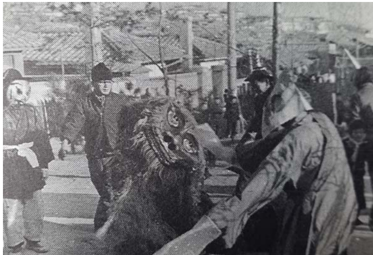
〈사진 5〉 1957년 속초에서 북청사자놀음 장면