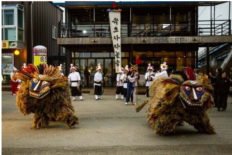
〈사진 6〉 속초사자놀이 공연 1

봄철 강가에서 달래를 캐다가 “돈돌라리 돈돌라리 돈돌라리요, 시내강변에 돈돌라리요, 모래산천에 돈돌라리요, 보배청산에 돈돌라리요, 오막살이 초가집에 모래강산에 리라 리라 리 돈돌라리요 리라 리라리 돈돌라리요.”라고 노래 부르고 춤을 춘다. 이 말뜻은 일제강점기 나라를 빼앗겼을 때 ‘동틀날’ 즉 조국광복의 여명이 밝아온다는 뜻에서 불렀다고 한다. 45 아래 사진은 2018년 3월 2일 정월대보름날 속초 청호동에서 펼쳐진 속초사자놀이 공연 모습이다.