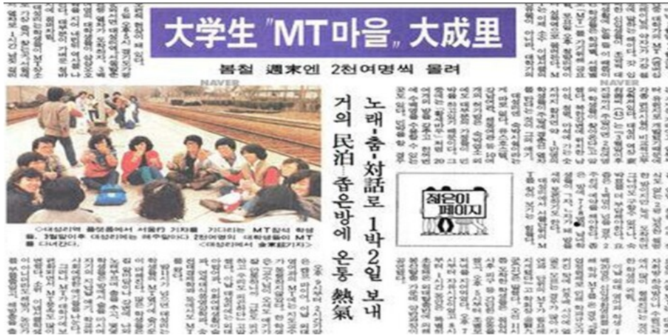
<사진1> 「대학생 MT 마을 대성리」, <조선일보> 1985년 4월 10일 기사

지역 사회의 협력, 다양한 문화 프로그램 개발이 필요하며, 지역 경제 활성화와 주민 삶의 질 향상을 위해 지속적인 노력이 요구된다. 이처럼 경춘선의 가치는 단순한 관광 자원을 넘어, 지역 문화와 문화 자산으로 발전할 가능성을 가지고 있다.