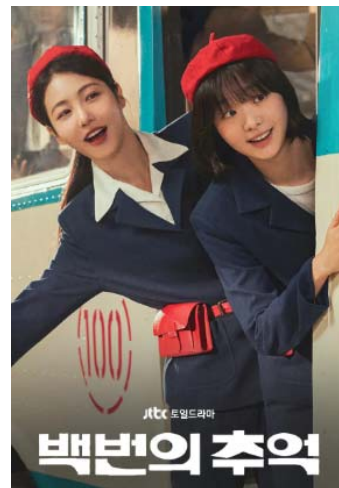
<사진 3> <백번의 추억> 포스터

무엇보다 <백번의 추억>이 특별한 이유는, 그 중심에 안내양들의 ‘우정과 사랑’이라는 인간적인 이야기를 두고 있다는 점이다. 이들은 단지 버스의 노동자나 보조 인력이 아니라, 한 시대를 상징했던 ‘이동과 일상의 연결자’로서 존재했으며, 그 속에서 자신들의 꿈과 고민, 관계를 쌓아갔다. 드라마는 이들의 일상과 갈등, 성장의 과정을 통해 시대를