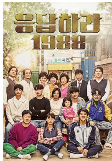
<사진 1> 레트로 시리즈의 시작을 연 <응답하라>

2000년대 레트로 감성 드라마의 시작은 <응답하라> 시리즈였다. 그리고 이러한 흐름은 2025년 현재에도 계속되고 있다. 이러한 흐름을 대표하는 시대극 K-드라마로는 <폭삭 속았수다>, <백번의 추억>, <태풍상사> 등이 있다.