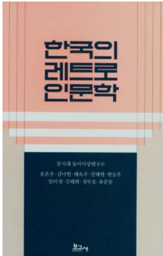
〈사진 5〉 레트로 인문학

주목할 만하다. 과거를 직접 경험하지 못한 젊은 세대에게는, 당대의 감정과 사회 분위기를 체험할 기회가 없었지만, 드라마는 정교한 미장센과 스토리텔링을 통해 그 시대를 감각적으로 ‘살아보는’ 경험을 제공한다. 1950~60년대 궁핍한 생활상, 1980년대의 대중문화, 1990년대 직장 문화는 단순한 시청각적 장치에 그치지 않고, 인간의 보편적인 감정과 상황을 통해 세대 간 공감대를 형성하는 데 기여한다. 이는 과거에 대한 단순한 향수 소비를 넘어서, ‘과거를 통한 감정의 공유’라는 보다 깊은 층위의 소통을 이끌어낸다.