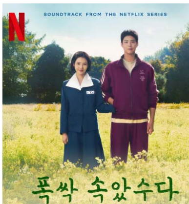
〈사진 2〉 〈폭삭 속았수다〉 포스터

주인공 ‘애순’과 ‘관식’의 일대기는 한국형 시대극이 자주 택하는 서사 구조인 ‘삶의 성장과 역사적 격동의 교차’를 잘 보여준다. 두 인물이 사랑, 이별, 재회, 그리고 고난을 겪으며 성장하는 과정을 통해, 개인의 삶이 어떻게 사회적·역사적 흐름 속에 위치하고 영향을 받는지를 보여준다. 이는 단지 로맨스나 개인 드라마를 넘어서, ‘역사 속 개인’이라는 보다 넓은 시야를 제시하며, 보는 이로 하여금 자신의 삶과 사회, 역사를 연결지어 사유하게 만든다.