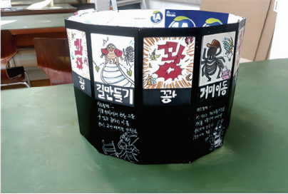
〈그림 4〉 박○태, 나의 지니