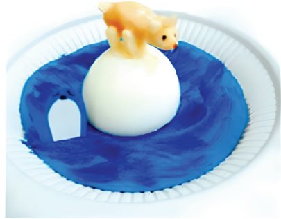
〈그림 2〉 김○진, 하트여왕