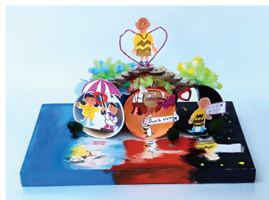
〈그림 7〉 최○은, 환상의 섬