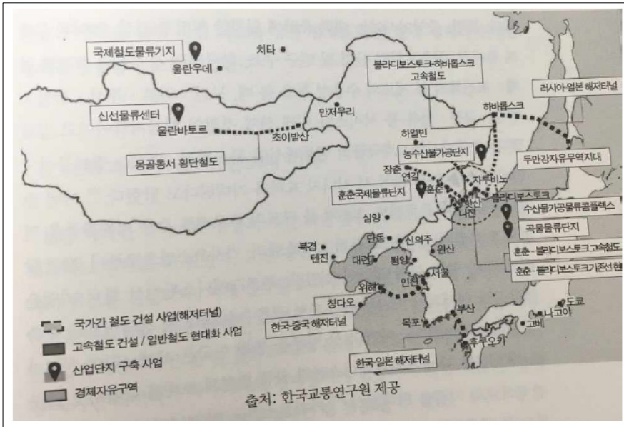
图5. 东亚铁路共同体具有前瞻性主要合作方案