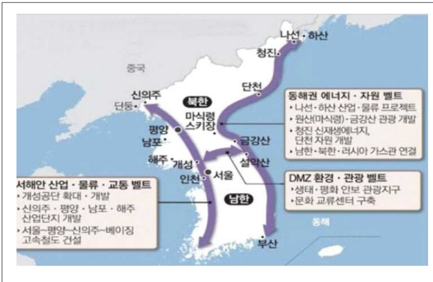
图2. 韩半岛新经济地图构想与南北经济合作

最后,“一个市场”既是南北韩经济合作的目标,也是建立制度性、人力基础的事业,最重要的是营造韩国企业安全、自由在朝鲜经营的制度环境。 19)