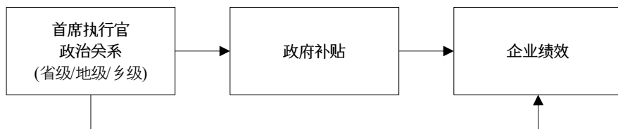
图 2. 研究模型