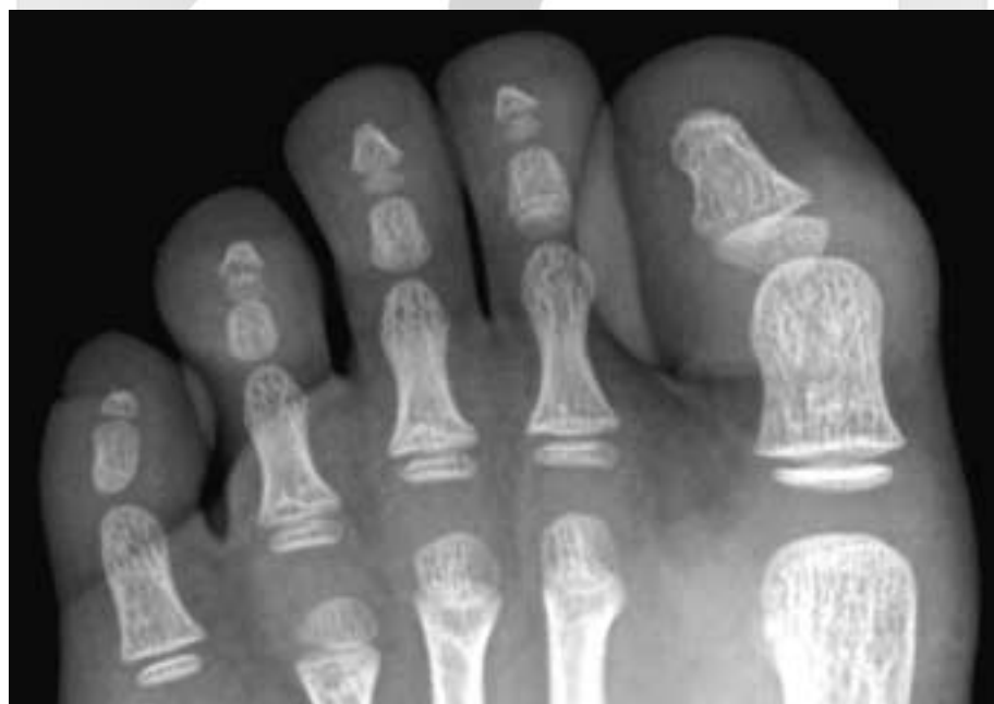
Fig. 4. Anterior-posterior view of plain radiograph showing 3 ossicles on 5th toe in a 4 year-old-boy. Epiphyseal ossification centers are seen in each proximal phalanges, which are not fused with shaft bone.