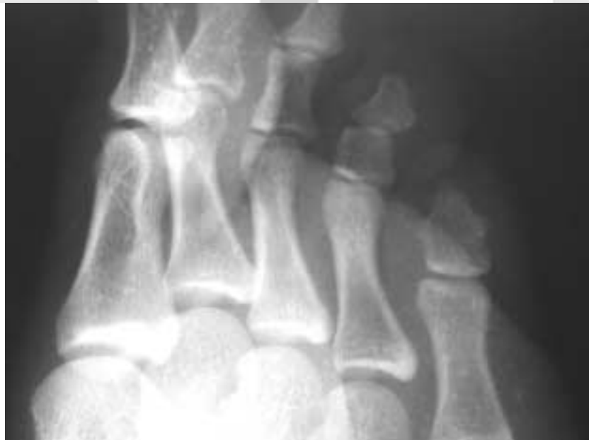
Fig. 2. Oblique view of plain radiograph showing two-phalanged 5th toe in a 15 year-old-girl. Ossification center is unseen any more, which already seems to fused with shaft bone.