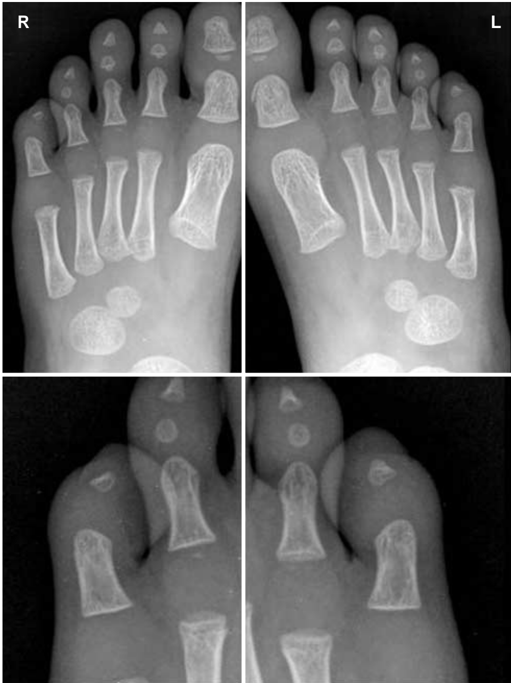
Fig. 5. Anterior-posterior view of plain radiograph showing only 2 ossicles on 5th toe in a 2 year-old-boy. Epiphyseal ossification centers are seen in each distal phalanges of halux, which are not fused with shaft bone. Middle phalanges are ossified on 2nd to 4th toe except for 5th toe.