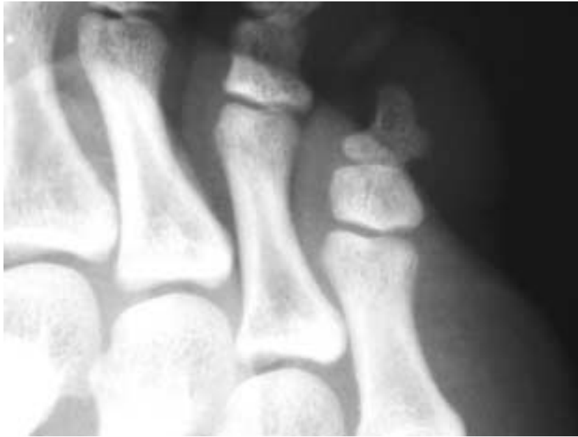
Fig. 1. Oblique view of plain radiograph showing three-phalanged 5th toe in a 15 year-old-boy. Ossification center is unseen any more, which already seems to fused with shaft bone.