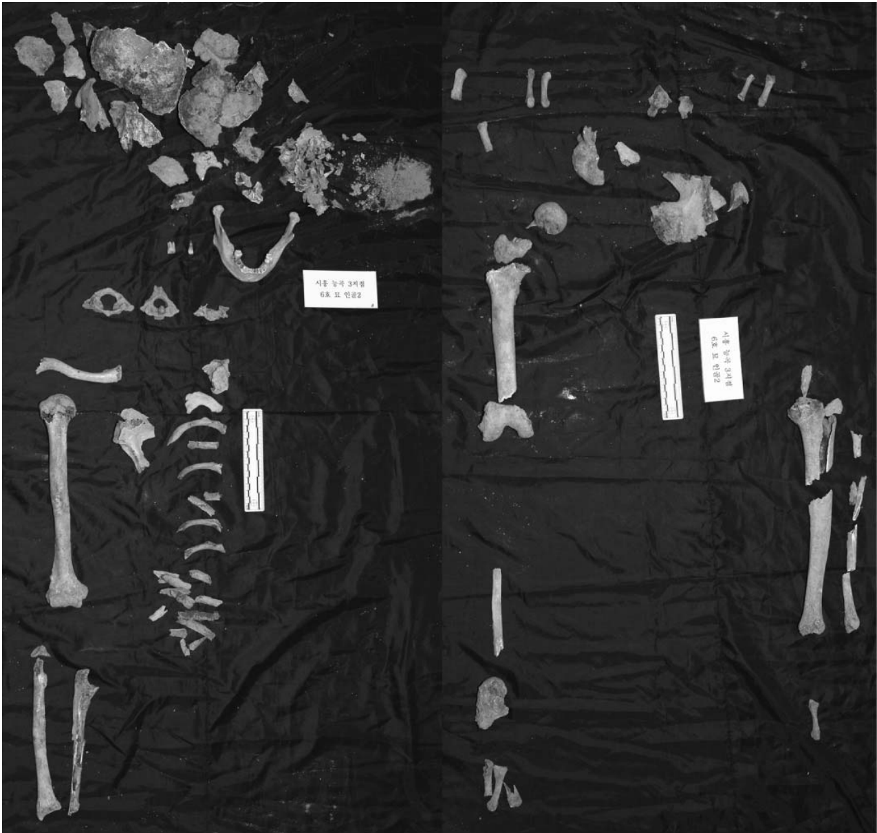
Fig. 10. Picture of excavated skeletons in Site 3-16R.

현재 신원확인을 위해 사용되고 있는 체질인류학적 자료들은 파손되지 않은, 형태가 완전한 뼈들을 이용한 연구결과이다. 하지만 이 보고서와 같이 묘에서 발굴되거나 현장에서 발굴되는 뼈들의 형태는 부분적으로 파손되거나 소실되는 경우가 많다. Kim 등(2010)은 현장에서 발굴된 백골화시신도 작은뼈의 발굴빈도가 낮았고 발굴된 다른뼈들의 상태가 온전한 것보다는 부분적으로 혹은 많은 부분이 파손된 것이 많다고 언급하였다. 이번 시흥 능곡지구에서 발굴된 뼈들도 역시 많은