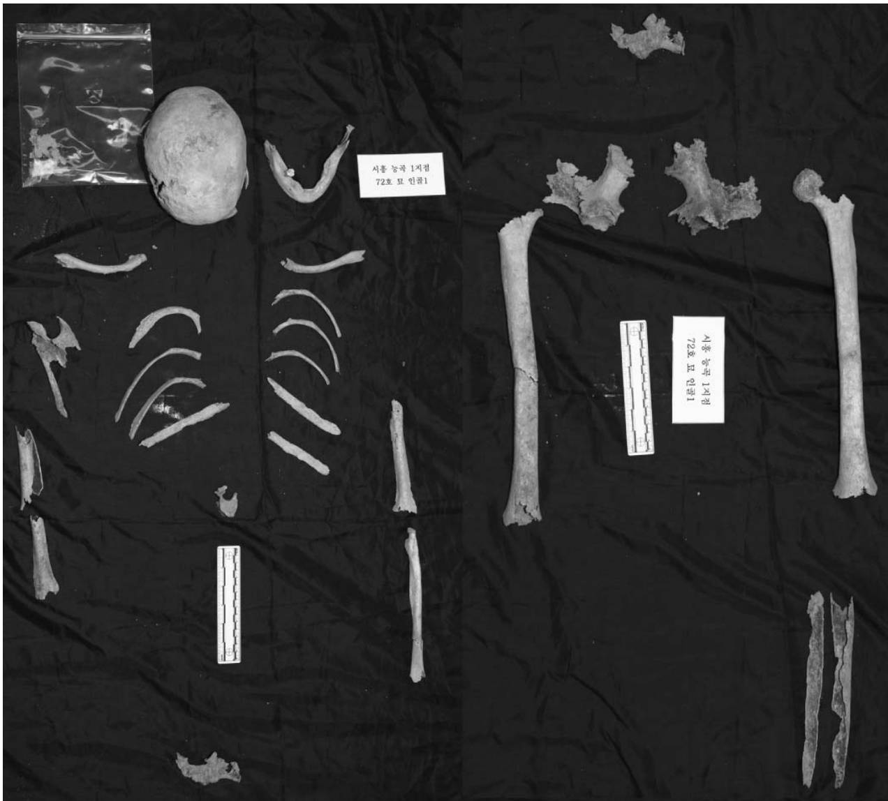
Fig. 5. Picture of excavated skeletons in Site 1-48.