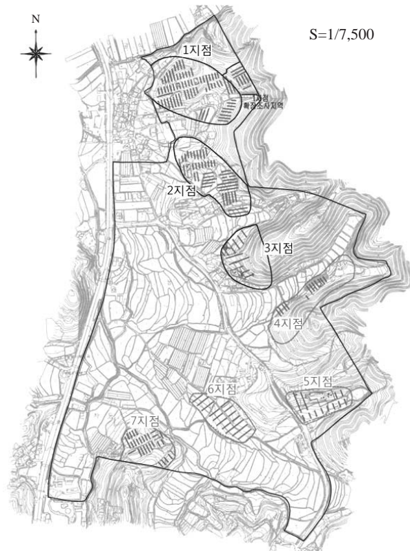
Fig. 1. Prospecting map in Siheung Neunggok residential development district. Skeletal remains found in Site 1~3.

고 3지점 2개 묘에서 발굴된 총 8구의 사람뼈를 발굴 장소에 맞춰 뼈의 종류와 개수를 정리하였다. 정리한 후 개체 별 사진촬영을 하고 신원확인에 필요한 뼈는 따로 사진촬영을 하였으며 머리뼈(skull)와 머리이후뼈대(postcranial skeleton)로 분류하여 분석을 시행하였다.