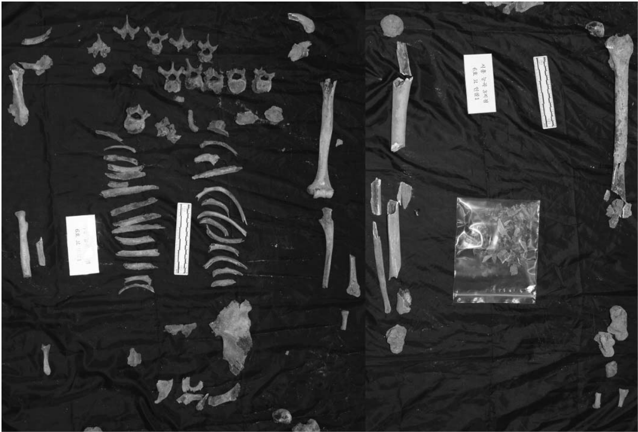
Fig. 9. Picture of excavated skeletons in Site 3-9R.

를 제외하고는 회곽묘 매장 행위 당시의 내용을 잘 보존하고 있는 특성을 가지고 있다(Kim 2006, Shin 등 2006, Kim 등 2010). 의뢰된 8구 중 1지점 28호묘와 2지점 3호묘는 토광묘이며 나머지 6구는 회곽묘로 조성되었다. 토광묘에서 발굴된 뼈의 상태가 회곽묘에서 발굴된 다른 뼈들과 비교하였을 때 그 상태가 양호하였으며 오히려 회곽묘에서 발굴된 뼈가 상태가 좋지 않은 것이 있었다. 이러한 상태의 차이가 시대적 차이 때문이라고 생각하나 발굴 시 묘에서 유물이 함께 나오지 않아 정확한 시대를 추정할 수 없었다. 발굴된 사람 뼈의 시대추정은 같이 매장되어 있었던 유물이나 분묘 그 자체의 양식 등을 토대로 하여 추정하며 시대를 알 수 있는 명확한 유물이 함께 나오지 않으면 시대를 추정하기 어렵다(Kim 등 2010).