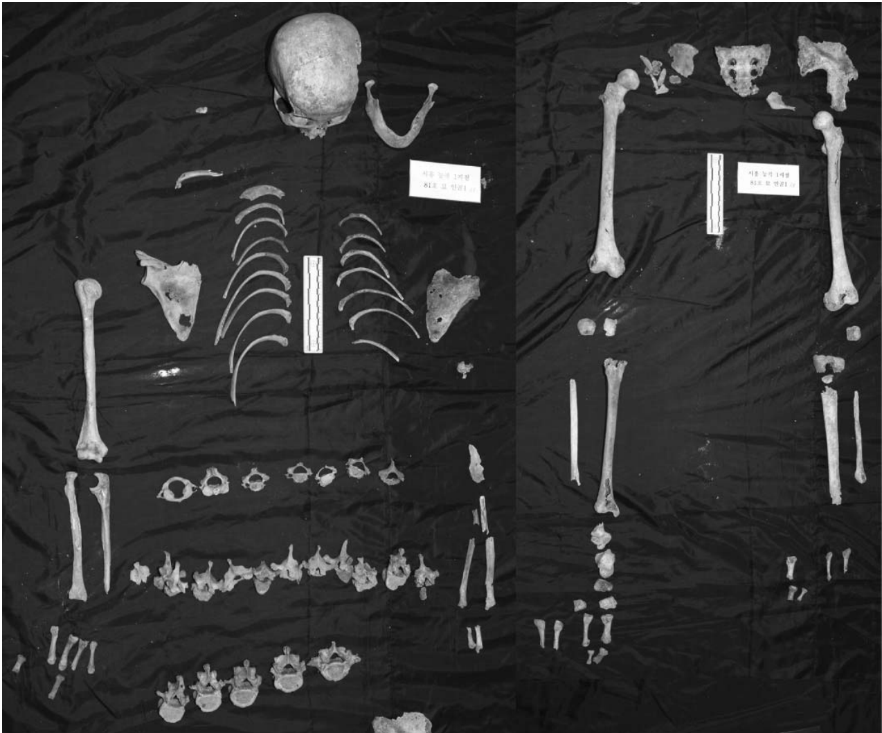
Fig. 7. Picture of excavated skeletons in Site 1-53R.