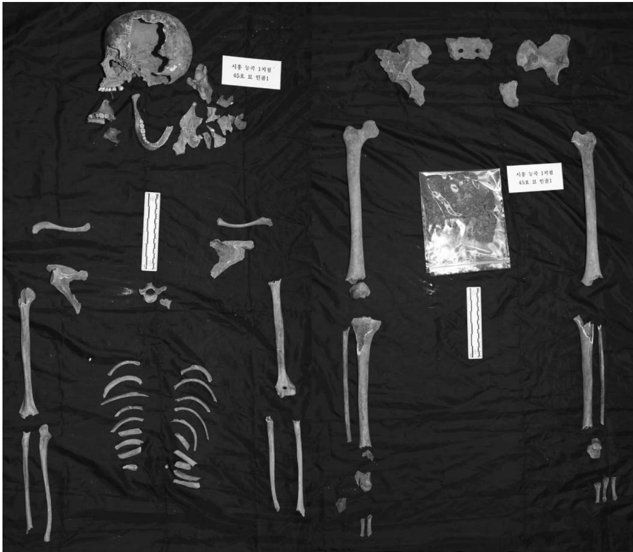
Fig. 3. Picture of excavated skeletons in Site 1-28 from Neuggok residential development district within Shieung-si.

*To measure maximum length of long bones.