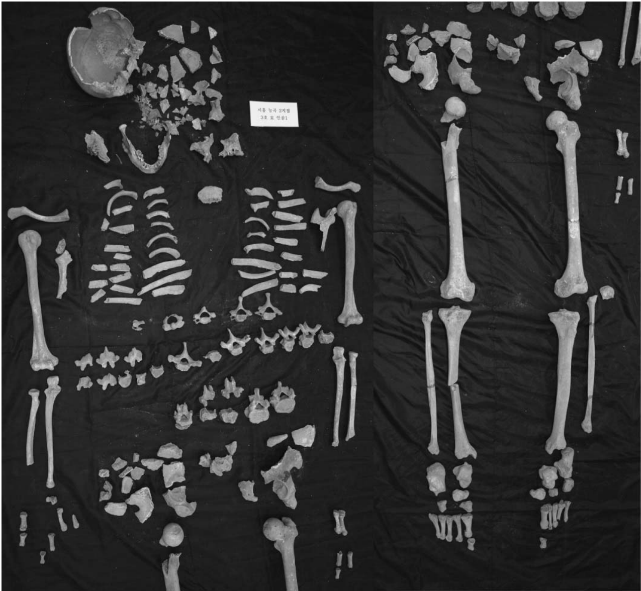
Fig. 8. Picture of excavated skeletons in Site 2-3.

된 것인데 그 중 2구만 남자뼈이고 2구는 여자뼈이었다(Table 1). 이와 같이 합장묘 피장자인 남자와 여자의 자리가 바뀐 경우를 조선시대의 다른 묘에서도 확인할 수 있었다(Lee 등 2008). 합장묘는 축조방식에 따라 한 굴광 안에 두 개의 방을 만드는 방법과 한 굴광에 하나의 방을 만드는 방법으로 크게 분류할 수 있다. 의뢰된 사람뼈 중 합장묘에서 발굴된 5구 중 4구는 대부분 하나의 굴광 안에 두 개의 방을 만들어 매장하는 방법을 사용하였다. 3지점 9호묘의 경우 하나의 굴광에 동시에 두 개의 관을 안치하고 네 벽과 두 관 사이에 회를 섞