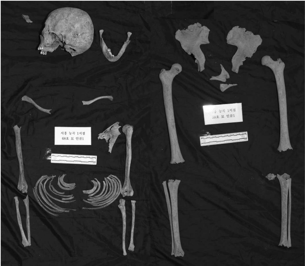
Fig. 4. Picture of excavated skeletons in Site I-45R.

해 손상 정도가 컸다. 손과 발뼈는 발굴되지 않았으며 발굴된 다른 뼈들의 경우에도 파손 정도가 심하며 치아도 거의 결손되었다. 얼굴뼈 (facial bone)와 머리뼈바닥 (skull base) 부위 소실이 있었고 아래턱뼈에는 이틀뼈 흡수 (alveolar resorption)가 있었다. 순서를 알 수 없는 등뼈 몸통 (body of thoracic vertebra) 하나와 부분을 알 수 없는 엉치뼈 일부분을 발굴하였다. 발굴된 긴뼈의 경우 양쪽 뼈끝이 모두 파손되었다.