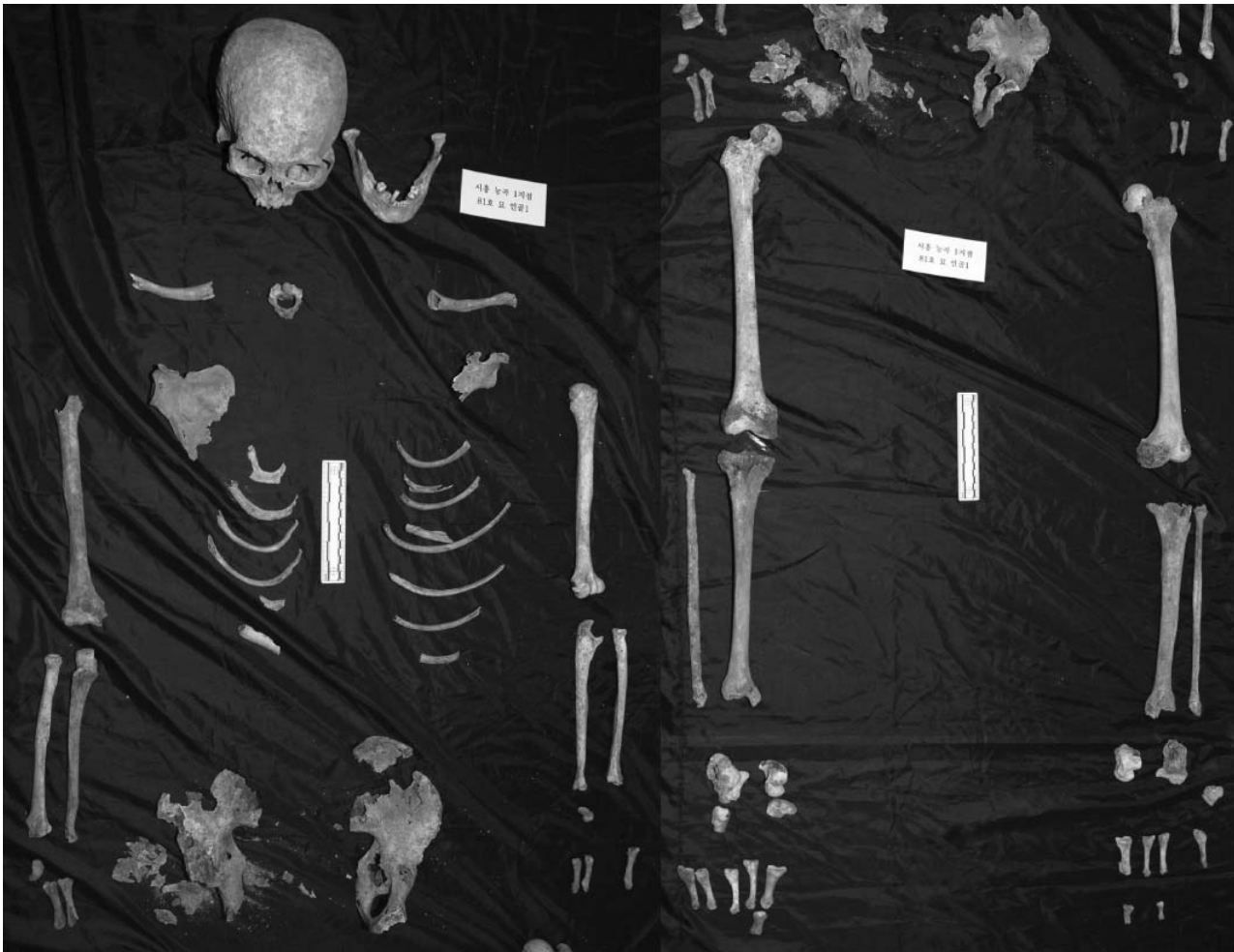
Fig. 6. Picture of excavated skeletons in Site 1-53L.