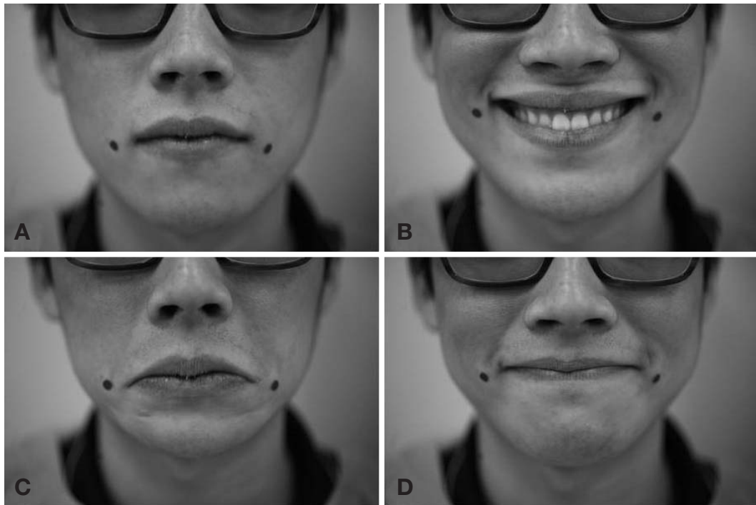
Fig. 3. The location change of the modiolus according to expression (sex: male, age: 23, (A) absence of expression, (B) pull the mouth angle up, (C) pull the mouth angle down (D) pull the mouth angle both side).

다[7,8,14]. 볼굴대가 아래쪽유형인 경우 큰광대근이 길어 자연스럽게 입꼬리가 위가쪽으로 움직이는 모나리자 미소를 짓게 되고, 위쪽유형 또한 큰광대근이 입꼬리의 가쪽에 닿아 있어 모나리자 미소를 짓게 된다. 반면 가쪽유형의 경우 큰광대근이 짧고 위입술올림근의 작용이 우세하여 윗입술을 올리게 되는 개과유형의 미소가 나타나게 된다[7,8]. 이 연구는 살아있는 사람을 대상으로 하였기 때문에 실험대상자들의 미소를 세 가지 유형으로 분류한 뒤 볼굴대의 유형과 비교하여 보았다(Fig. 2). 모나리자 미소로 예상되는 아래쪽유형과 위쪽유형을 합하면 73.0%이며, 볼굴대와 상관없이 실험대상자들의 표정에 따른 미소의 유형을 분류하였을