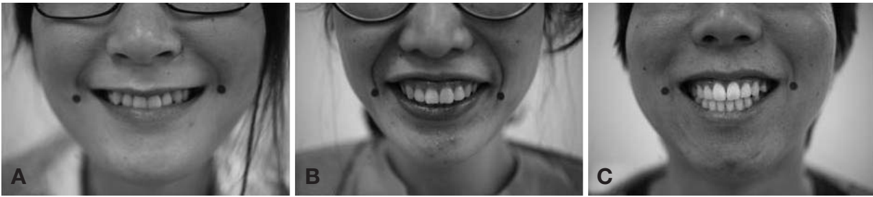
Fig. 2. The type of smile according to Rubin (1974). (A) “Mona Lisa” smile, (B) “canine” smile, (C) “full denture” smile.