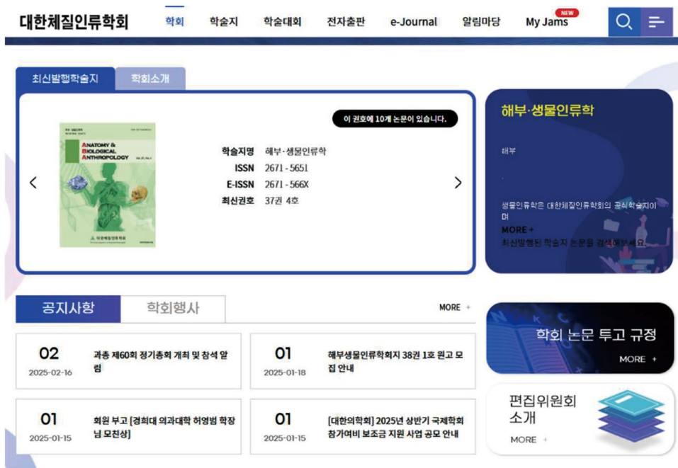
Fig. 3. The website of the Korean Association of Physical Anthropologists.