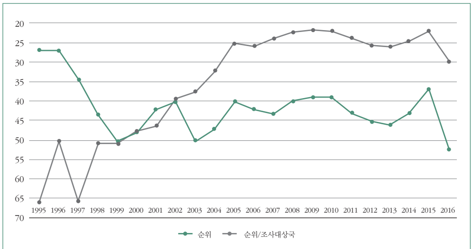
그림 1 아시아 국가별 뇌물경험의 비교