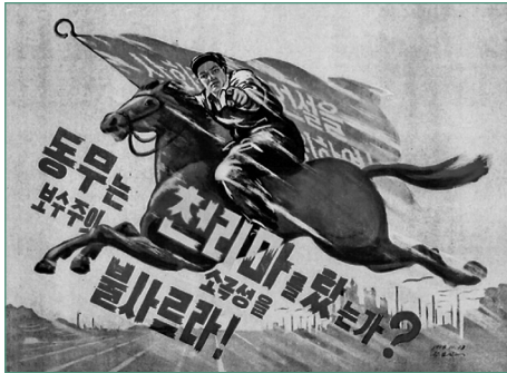
그림 7 「동무는 천리마를 탔는가? 보수주의 소극성을 불사르라!」, 곽흥모, 1958