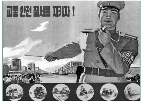
그림 8 「교통 안전 질서를 지키자!」, 작가미상, 1966