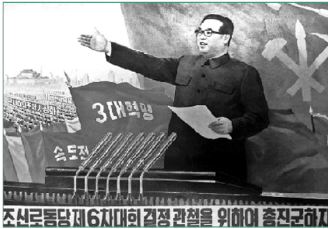
그림 3 「조선로동당제6차대회 결정 관철을 위하여 총진군하자」, 작가 미상, 『조선예술』, 1981