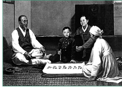
출처: 『영원한 태양의 해발』(2007).