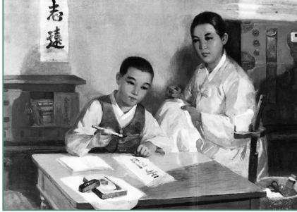
출처: 『주체미술 교육의 빛나는 50년』(1997).