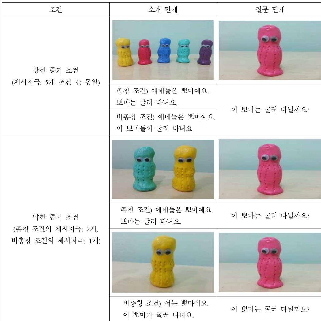
그림 1. 실험 2-1의 실험 단계 과정

하였다(예, 애네들은 파소예요. 애네들의 이름은 파소예요. 파소는(총칭)이 파소들이(비총칭) 빨리 달려요.). 아이들이 대상과 속성을 연결하여 확실히 이해할 수 있도록 같은 내용의 소개를 3번 반복하였다.