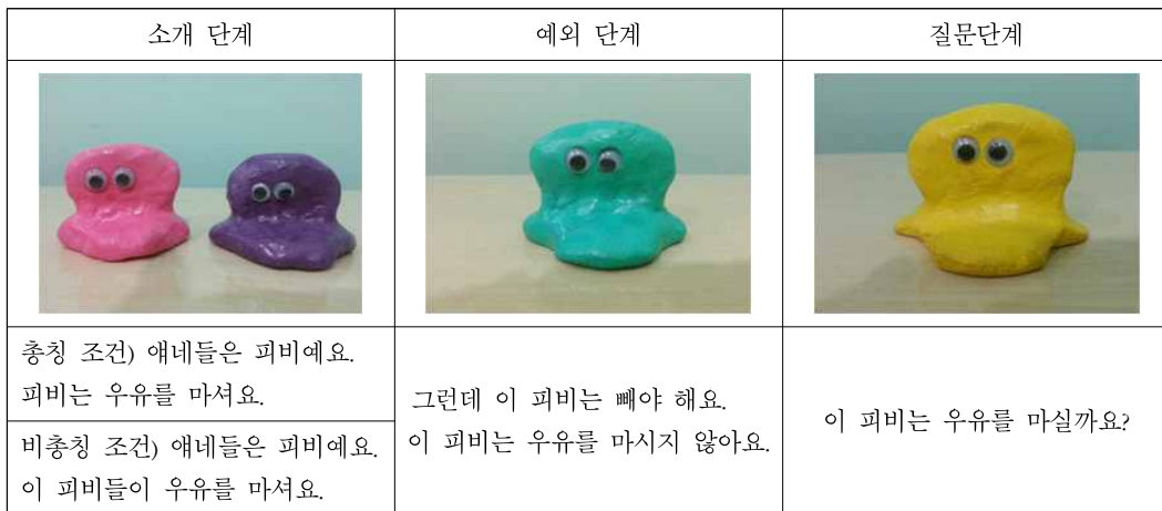
그림 3. 실험 2-2의 실험 단계 과정

유아는 1개의 조건에만 참여하여 연구가 진행되었으며, 각 조건 당 총 6번의 시행(6 종류의 생물체를 대상으로 한)을 제시하였다. 실험자는 각 질문에 대한 아이의 대답을 코딩하였다. 실험 2-2에서는 실험 2-1과 동일하게 실험자의 질문에 긍정적인 답변을 하는 경우에는