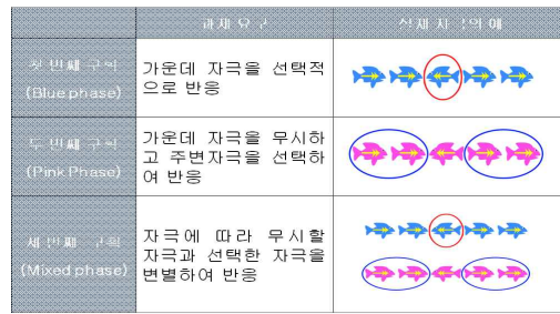
그림 1. Computer based Flanker Task

실행기능을 측정하는 도구로 Munro, Chau, Gazarian과 Diamond(2006)의 Flanker 효과에 관