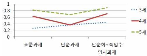
그림 2. 연령과 과제유형에 따른 아동의 암묵반응

연령과 과제유형에 따른 암묵반응의 변량분석 결과, 이차순위 틀린믿음 이해의 암묵반응에 대한 연령의 주효과( F(2, 76)=14.79 , p<.001 )가 유의한 것으로 나타났다. 사후검증 결과, 5세의 암묵반응 수행이 4세와 3세 보다 유의하게 높았다. 또한 4세의 수행이 3세보다 유의하게 높다는 결과가 나타났다. 따라서 연령이 증가할수록 이차순위 틀린믿음의 암묵반응이 더 높게 나타나는 것을 확인할 수 있었다.