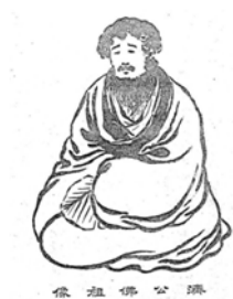
圖十 上海神靈學會《真正財運預知術》 (民國八年)