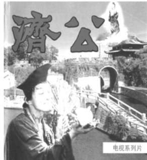
圖一 中國大陸電視連續劇《濟公》 (1985年)