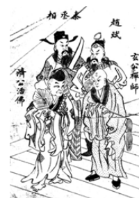
圖十四 《評演濟公傳》插圖 (民國十二年)