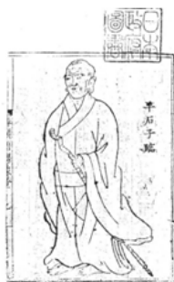
圖四 《錢塘湖隱濟顛師語錄》插圖 (明隆慶年間)