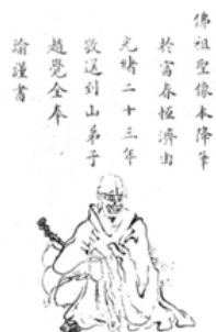
圖八 《虎跑佛祖藏殿志》濟公像 (清·光緒二十三年)