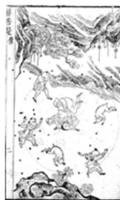
圖五 清 墨浪子《醉菩提》插圖 (清康熙年間)