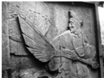
圖三 杭州虎跑泉濟顛塔院浮雕 (1990年代)