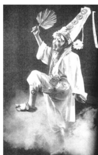
圖十三 江南目連戲中的無常 (當代)