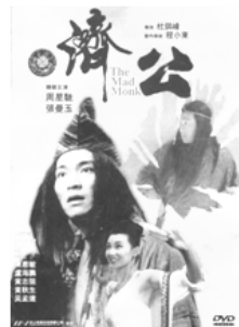
圖二 香港電影《濟公》 (1993年)