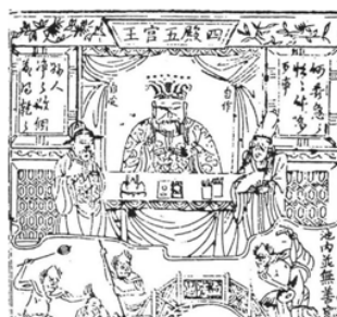
圖十二 《玉曆鈔傳》插圖中的無常 (清 道光年間)