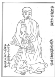
圖七 《淨慈寺志》濟顛像 (清 乾隆年間?)