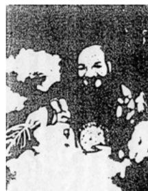
圖十一 《濟公活佛》濟公真像 (民國初期)