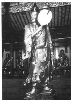
圖九 蘇州西園戒幢律寺的濟公像 (清 光緒年間)