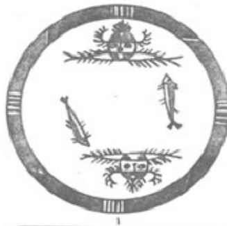
그림 6. 姜寨人面魚紋盆2 평면도

甕棺葬은 주로 아동이나 小兒에 대해 행해졌다. 옹관은 독과 陶鉢이나 陶盆이 합쳐져 하나의 棺이 된다. 비교적 큰 아동에 대해서는 두 개의 큰 독을 마주 끼웠으며, 어떤 것은 여러 명을 合葬한 것도 있었다고 한다. 7)