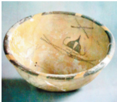
그림 5. 姜寨 人面魚紋彩陶盆1