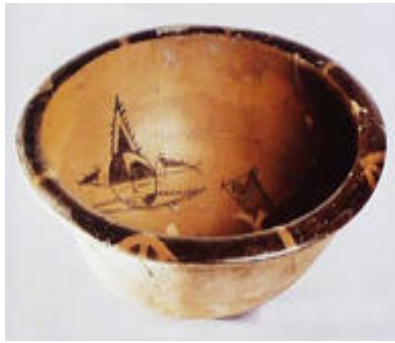
그림 3. 半坡 人面魚紋盆

棺葬을 행할 때 옹관의 뚜껑으로 사용되었음을 고찰 한 바 있는데, 이에 소개하면 아래와 같다.