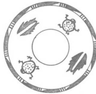
그림2. 姜寨 魚蛙紋盆 평면도

姜寨유적은 같은 신석기시대 仰韶文化에 속하는 西安 半坡유적과 불과 15km 정도의 거리에 있다. 그래서 출토된 유물들이 서로 비슷한 것들이 많은데, 그 중에서도 '人面魚紋'은 각기 다른 半坡(그림 3과 4)와 姜寨(그림 5와 6)에서 출토되었지만 그 형태가 매우 흡사하고, 문양도 모두 盆의 내벽에 그려져 있다는 공통점이 있다. 특히 人面魚가 양 입가에 한 마리씩 두 마리의 물고기를 물고 있는 것은 놀라우리만치 같다. 이러한 유사성에 대하여, 趙國華는: