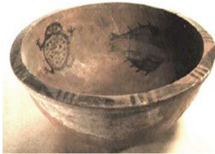
그림 1. 姜寨 魚蛙紋盆