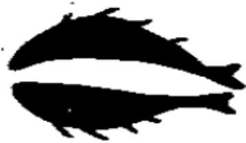
그림 8. 姜寨 魚蛙紋盆의 雙魚紋

농경생활에서 稻作에는 많은 인력이 필요함을 인식하고, 그들은 生殖의 중요성을 더욱 깨달았다. 生殖은 原始人類社會에서 가장 관심을 기울인 문제 중의 하나였다. 당시에는 자연재해가 인류에게 주는 거대한 危害와, 씨족부