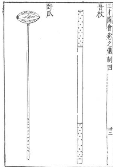
[그림 6] 금오(金杼)는 아마 오장(杼杖)의 앞뒤에 금박을 입힌 병기였을 것이다.

제69회의 묘사는, 당(唐)나라 소미도(蘇味道)의 《정월15야(正月十五夜)》詩를 응용한 표현이다.