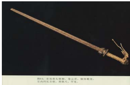
[그림 3] 宋나라 때의 鐵鋼 鄭鐵偉, 《古代冷兵器》, 上海: 上海文化出版社, 2008.

宋나라 曾公亮의 《武經總要·器圖》: “鐵鞭과 鐵簡 두 종류가 있다. …… 또한 네 개의 모서리를 만든 것도 있는데, 그것을 일컬어 鐵簡이라고 부른다. 네 개의 모서리가 대나무를 길게 쪼개어 놓은 죽간(竹簡)의 생김새를 닮아서 그렇게 부르는 것이며, 모두 鞭의 종류이다.” 26)