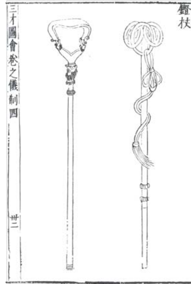
[그림 5] 등봉(鏡棒)은 등장(鏡杖)이라고도 부른다. 《삼재도회(三才圖會)》

《宋史·儀衛志六》: 등장(鏡杖)은 노(弩)의 발걸이 자루에 검은 색을 칠하여 만든다. 금동(金銅)으로 등자(鏡子) 및 꾸미개를 만들며, 그 끝에는 자줏빛 실끈을 묶는다. 56)