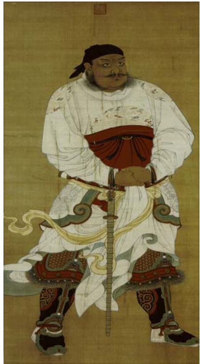
〔그림 2〕 張飛像 明나라, 故宮博物院. 張飛가 들고 있는 병기가 鐵鞭이다. 湖北省博物館編. 《千古英雄: “大三國志展”歸國滙報展》, 武漢: 湖北人民出版社, 2009. 150쪽.

《宋史·呼延贊傳》: “(북송 태종) 옹희(雍熙) 4년(987년)…… 宋 太宗 이 그를 불러들여 무예 시범을 보이 라고 명령하였다. 呼延贊이 군장을 갖추고서 철편(鐵鞭)을 쥐고서 말을 내달렸다. 철편(鐵鞭)과 대추나무 자 루로 만든 槊(棗槊)을 휘두르며, 마당 가운데를 서너 바퀴 돌았다.” 19)