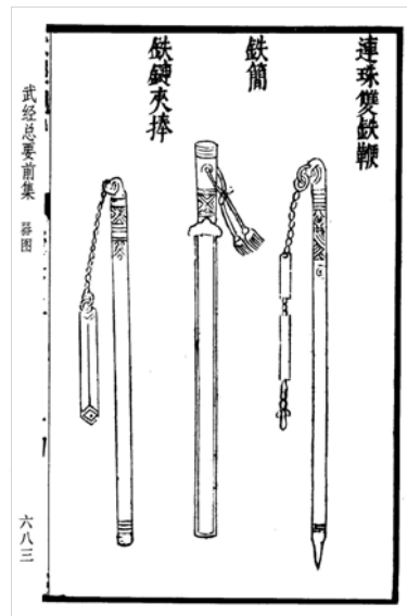
[그림 4] 가운데 있는 병기가 철간(鐵簡)이다. 《무경총요전집(武經總要前集)》

위의 두 기록에 근거하면, 鋼은 두꺼운 갑옷을 두른 기병을 상대할 때, 비교적