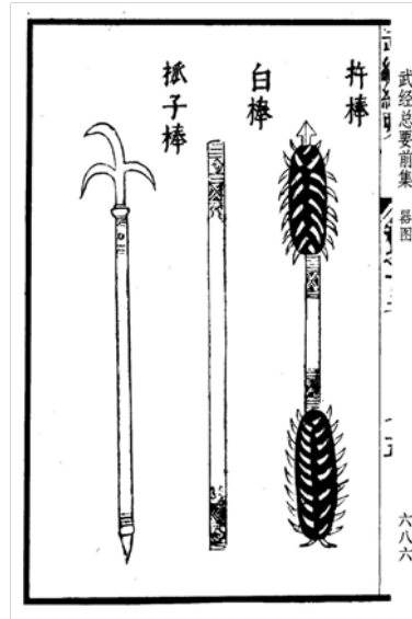
[그림 7] 저봉(杵棒) 《武經總要》