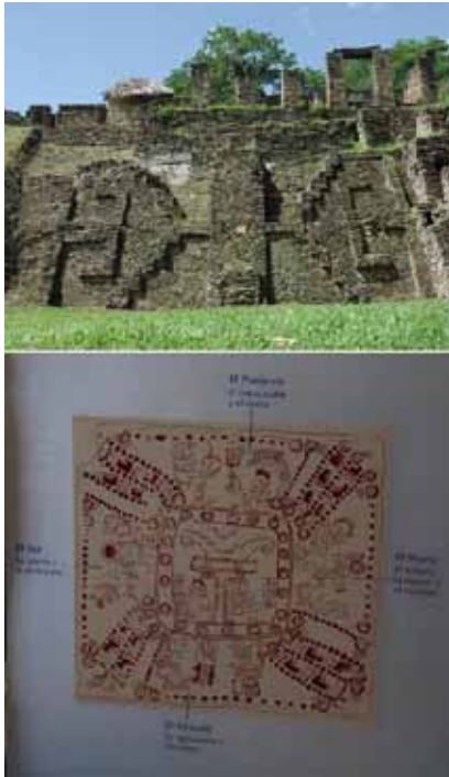
<그림-7> 또니나의 부조와 마야의 260일 달력과 사방의 조화.

이제 뽕뽕부에 의거하여 또니나의 스투코 부조를 해석해 보자. 25) 중앙을 구분하고 솟은 것을 생명나무(世界樹 또는 宇宙木)를 상징하는 것이라 본다면 사방으로 뻗은 네 개의 사선은 뽕뽕부의 기록에서처럼 우주를 설계한 끈(뱀)을 상징하는 것이라 할 수 있다. 26) 이러한 세계관은 왼쪽의 <그림-7>에서도 엿볼 수 있다. 위는 또니나의 플랫폼의 가운데에 있는 우주를 상징하는 문양이다. 중앙의 커다란 생명나무 축을 두고 사방으로 뻗어나간 선들은 우주의 별자리를 상징하는 끈들이다. 밑의 그림에서 보여지듯 사방(四方)을 상징하는 이 네 개의 끈은 마야의 제의력 260일을 나누어 담고 있는데, 이는 전체 우주에 있어 시공(時空)의 일치를 의미하는 것이 된다.