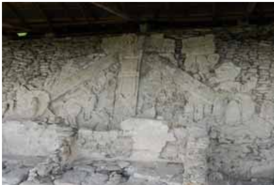
<그림 5> 또니나의 스투코 부조

예전에는 이 부조의 그림이 또니나에 패배한 빨랭계의 왕이 구기장에서 죽고 머리를 잘린 장면이라고 해석되기도 하였으나, 단순히 그렇게 볼 수는