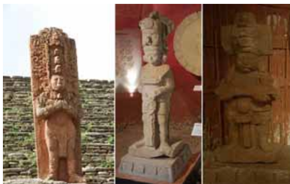
<그림-2> 석비에 새겨진 왕(ruler)들의 모습

도시의 위치에서 중심부로 급격한 상승을 이룬데 대한 과시 효과를 노리는 것이었다. 거대한 산의 사면 전체를 마치 하나로 만든 듯한 웅대한 규모의 피라미드 같은 건축물