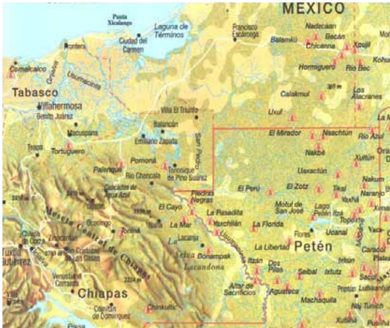
<그림-1> 우수마신타강 서부 지역 및 서북 변경 지역과 빼엔 지역의 고전기 마야 도시 국가들

<그림-1>은 또니나가 자리잡고 있는 우수마신타강 서부 지역과 서북부 변경 지역을 보여 주고 있다. 이 지역의 주도권 다툼은 고전기 전기와 후기로