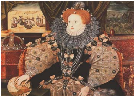
엘리자베스 1세의 초상화

장인물을 왜곡할 수 있기 때문에 작품의 이해를 돕기 위해 당대의 정확한 고증은 필수불가결의 요소이기 때문이다. 따라서 사극에서 의상은 극중 등장인물의 사회적 지위나 경제적 능력, 성격과 개성까지 나타내는 중요한 요소로 작용한다.