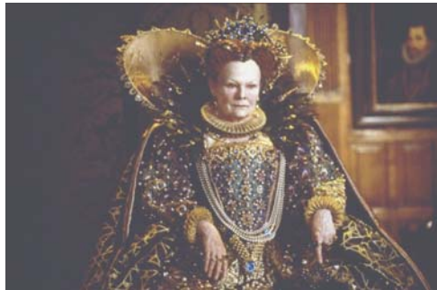
영화 <셰익스피어 인 러브>에서 엘리자베스 1세의 배역

※ 출처: http://uk.yahoo.com , 검색어 <Queen Elizabeth I>